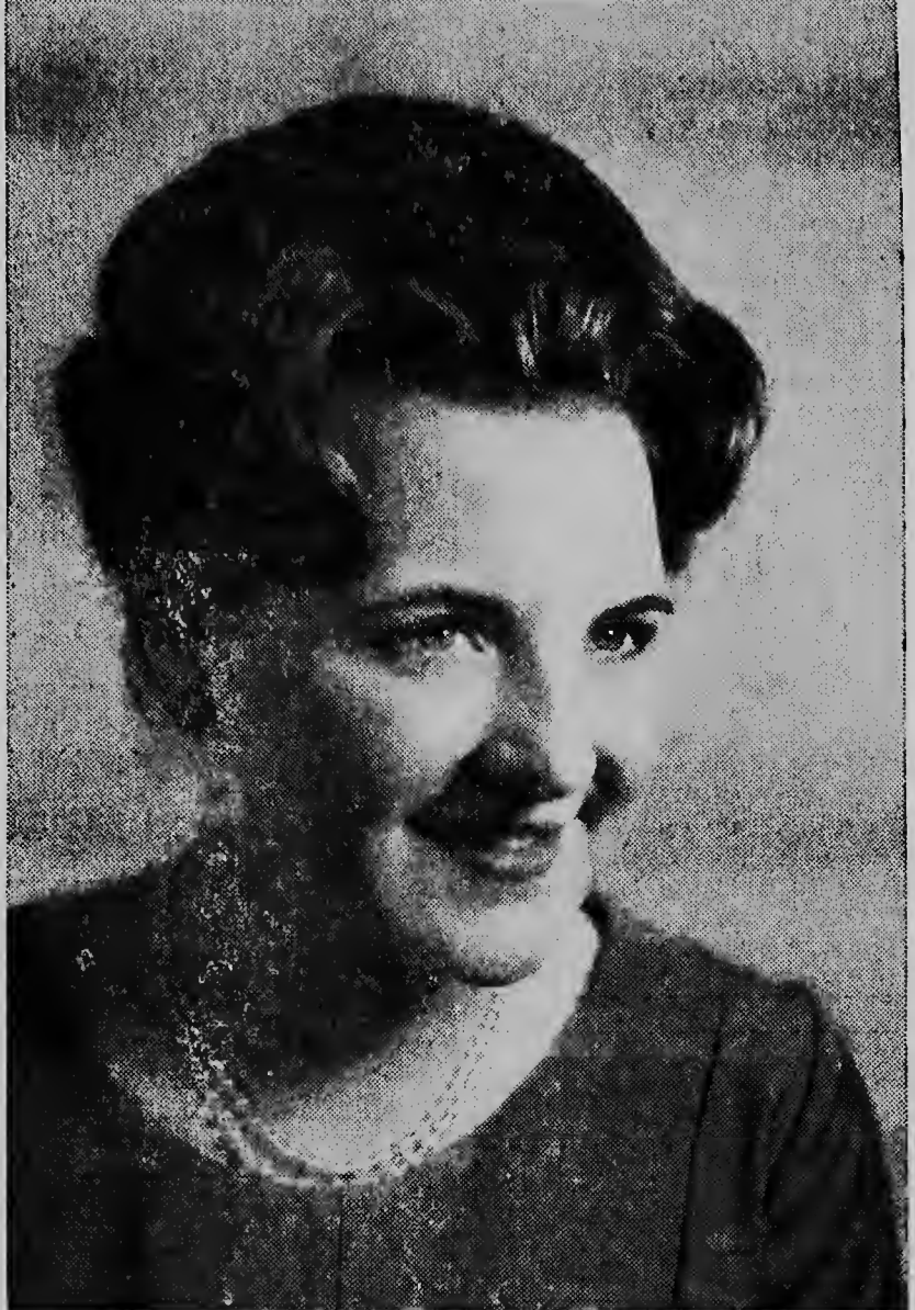
Esaki ta un portret recien di Su Alteza Real Prinses Margriet, cu ta cumpli 20 anja awe.